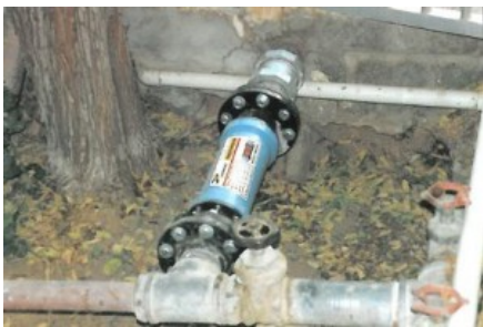
Instalaciones de riego