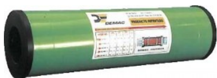
Instalación en piscinas