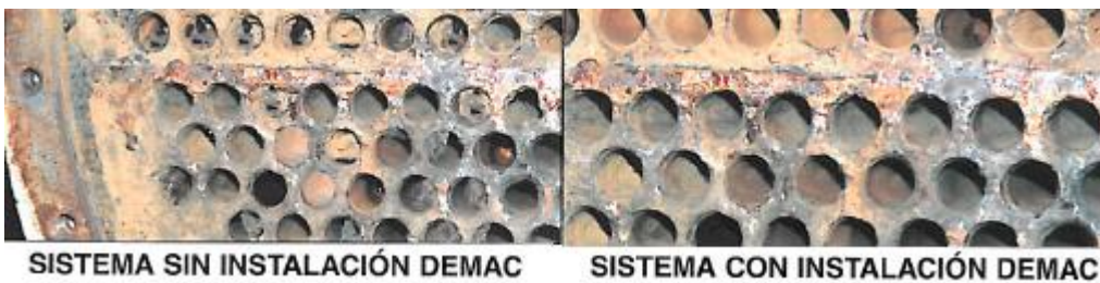
Resultados con y sin instalación Demac

El desincrustador actúa mediante la influencia que ejerce un intenso campo magnético sobre el flujo de agua al pasar a través de él.