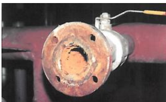
Problemas de la cal

Las consecuencias son conocidas por todos: